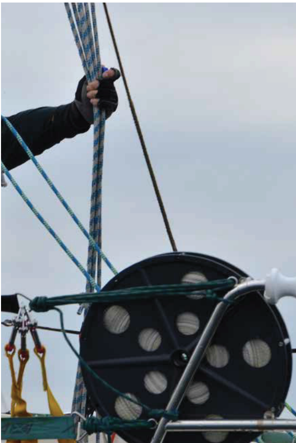
aller størst seilsportsarrangementene i Norge.