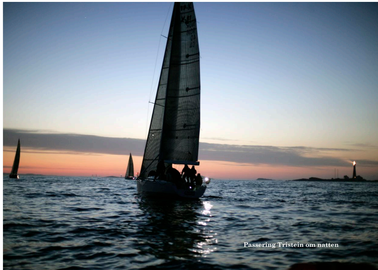
Passering Tristein om natten

Horten, i Sykestua ved Marinemuseet, Kommandørkaptein Klincksvei 2 Fredag 13. juni kl. 16.00 til søndag 15. juni kl. 10.00, tlf.: 33 04 83 16