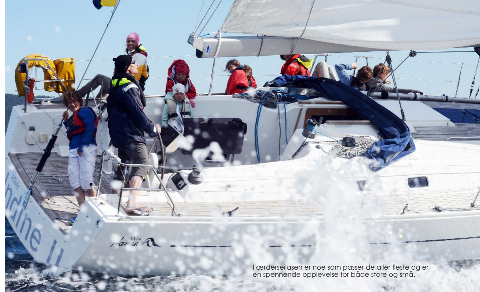
Færderseilasen er noe som passer de aller fleste og er en spennende opplevelse for både store og små.

det også mulig å fylle termos med kaffe til seilturen hjem.