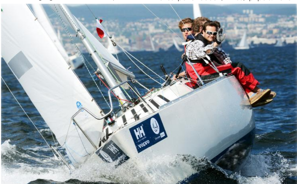
Sponsormerker føres på styrbord og babord baug

På arrangementsområdet vil du finne servering av mat og drikke. Våre sponsorer og samarbeidspartnere har eget telt med mange hyggelige aktiviteter. All underholdning vil foregå fra scenene på "Sykehusbryggen" og ved Roklubben fra lørdag formiddag (se kart s. 13). Grillene på Roklubben er varme fra kl. 10.00. Frokost på Roklubben serveres på søndagen fra kl. 08.00. Søndag kl 08.00 til 11.00 serveres det frokost på roklubben, kr 100,- pr pers. Her er